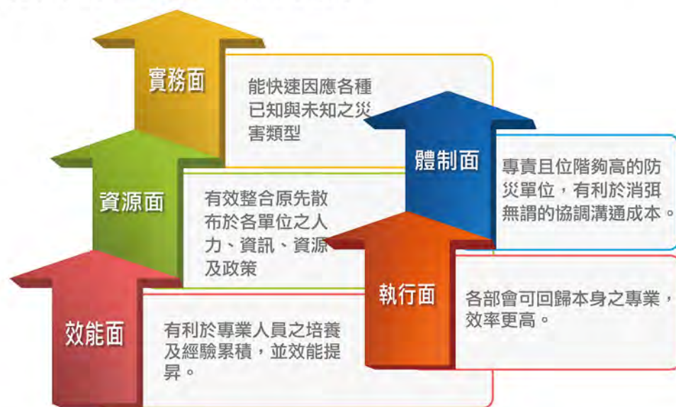
▲ 圖4、全災應變管理預期效益

在災害應變期間，若採用全災害管理機制，在實務面能快速因應各種已知與未知之災害類型；有效整合原先散布於各單位之人力、資訊、資源及政策；效能面有利於專業人員之培養及經驗累積，並效能提昇；體制面專責且位階夠高的防災單位，有利於消弭無謂的協調溝通成本；執行面使各部會可回歸本身之專業，效率更高。